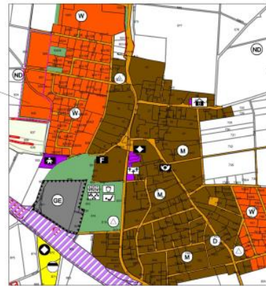
10. ÄNDERUNG, TAUBERFELD