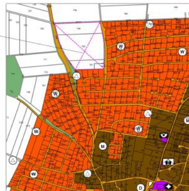
10. ÄNDERUNG, BUXHEIM