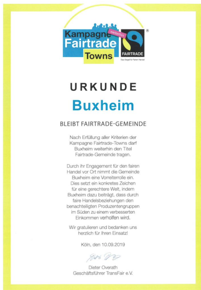
Benedikt Bauer 1. Bürgermeister