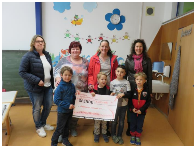
Spendenübergabe des Flohmarktteams Buxheim

Die Mittagsbetreuung „Buxheimer Löwenzahn e.V.“ in Vertretung von Frau Gloßner der Grundschule Buxheim freut sich über eine Spende von 200 Euro des Flohmarktteams Buxheim. Somit kann etwas Zusätzliches für die tägliche Arbeit und/oder Wünsche für die Schüler/innen und das Betreuungspersonal erfüllt werden.